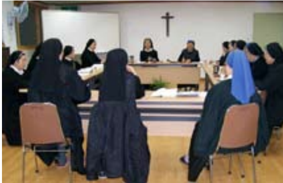
Die koreanischen Schwestern bei einem Delegationstreffen