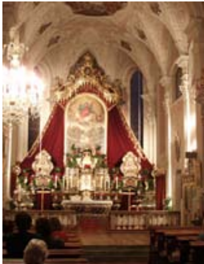
Nächtliche Anbetung in der Basilika von Maria Luggau

die Erhebung zur Basilika als besondere Auszeichnung für die überregionale Bedeutung der Wallfahrts- und Pfarrkirche. Die Basilika Maria Luggau sei ein besonderes Juwel in der geistlichen Landschaft weit über Kärnten hinaus. Jährlich kommen 40.000 Besucher und Wallfahrer nach Maria Luggau. Das sind in den 25 Jahren über eine Million Pilger. Es sei weiters eine Würdigung des reichhaltigen liturgischen und