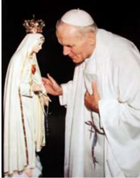
Ein eifriger Marienverehrer: der sel. Papst Johannes Paul II.

jene Brüder, die kein komplettes Studium im mariologischen Fach erhalten können, ist die Vermittlung von Grundkenntnissen über die Rolle der Mutter Gottes in der Heilsgeschichte während des Noviziates