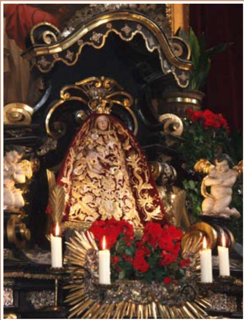
Das Gnadenbild von Maria Luggau (25 Jahre Basilika)