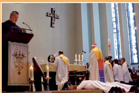
Während der Allerheiligenlitanei liegen die beiden Weiehekandidaten auf dem Boden