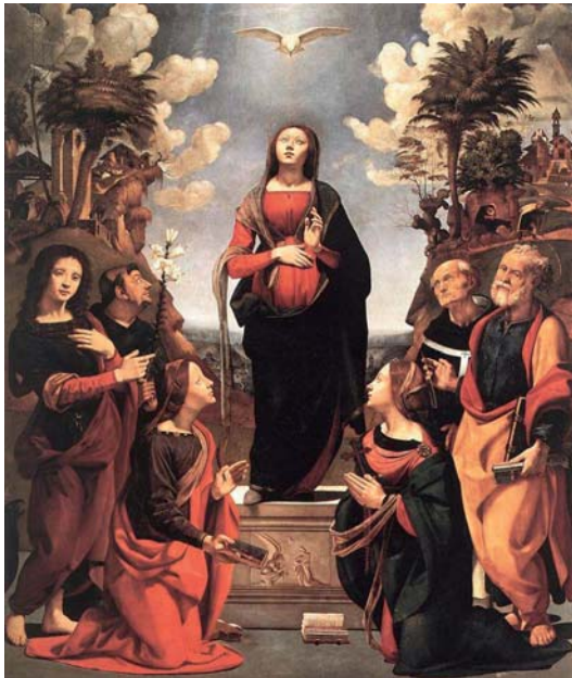
Philipp Benitius (2. v. rechts) und andere Heilige verehren die Gottesmutter; Piero di Cosimo, Florenz

ungsgeist auch im eigenen Orden zu fördern, hat die liturgische Kommission des Ordens Marienandachten ausgearbeitet, in welchen die traditionellen Glaubensinhalte im neuen Licht zur Betrachtung vorgelegt werden. Zu diesen Andachten zählt auch die neue Form von Benedicta tu von 1994 (für die „ältere Form“ siehe Servitanische Nachrichten 2009/2).