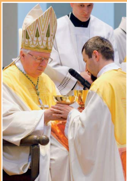
Überreichung von Hostienschale und Kelch