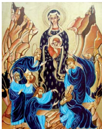
Die Gottesmutter mit den heiligen Sieben Vätern (Ikone von M. D'Aloisio)

Das erste Dogma lehrt, dass Maria „Gottesmutter“ ist. Obwohl hier von Maria die Rede ist, bezieht sich dieses Dogma in erster Linie auf Christus, es beantwortet nämlich die Grundfrage, die diesem ersten Dogma vorausging: „Wer ist Christus?“ Aus dieser Frage nach Christus ergab sich die Frage nach Maria. Es musste nämlich klargestellt werden, wen Maria eigentlich geboren hat. Die Frage, die Jesus einmal seinen Jüngern stellte: „Für wen halten die Leute den Menschensohn?“ (Mt 16,13), stellten sich auch später immer wieder viele andere. Und die vielen Antworten brachten