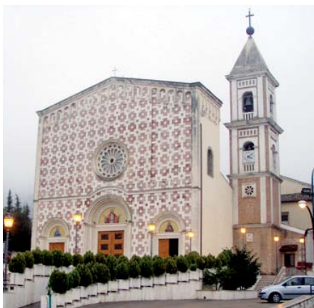
Die Kapuzinerkirche in Manoppello, in der der „Schleier der Veronika“ aufbewahrt wird

hand gemachtes Bild“ bekannt ist? Untersuchungen haben ergeben, dass das Tuch aus Muschelseide besteht, die aus den Haftfäden der im Mittelmeer lebenden Steckmuschel hergestellt wird. Dies sind Fasern, die keine Farbe aufnehmen. Bei mikroskopischen Vergrößerungen konnten deshalb auch keinerlei Farbpigmente festgestellt