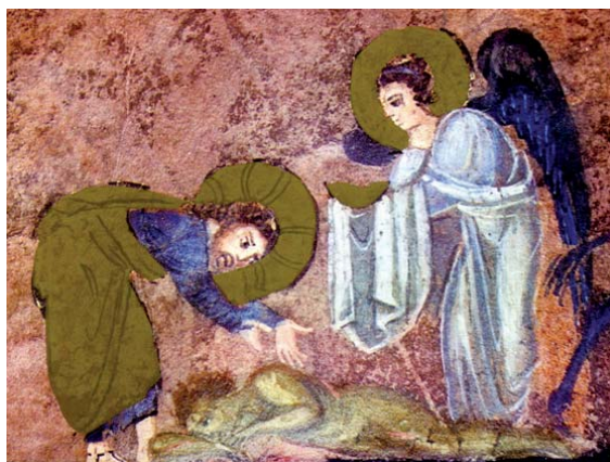
Christus als der barmherzige Samariter (Purpurkodex von Rossano, Syrien, 6. Jh.)