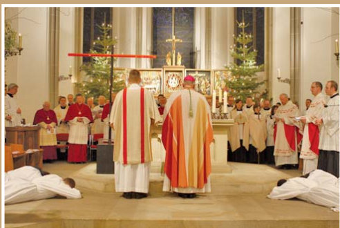
Unten: Dankmesse in der Kapelle des Priesterseminars in Bochum